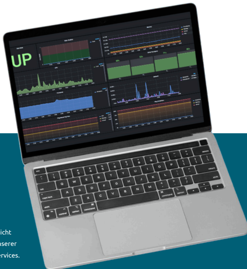
Beispielhafte Übersicht eines Monitoring unserer d.velop managed services.

Die Systempflege aus Produkt- und Herstellerhand unterstützt Sie, je nach gewünschter Tiefe, Ihr System zu optimieren und Ihre IT-Kollegen:innen um die Fachlichkeit ECM zu entlasten. Wir bieten Ihnen drei Pakete mit unterschiedlichen Komponenten an, die aufeinander aufbauen. So können Sie am besten aussuchen, was zu Ihnen passt.